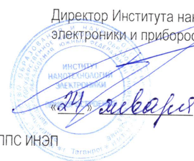
График ликвидации академической задолженности, добора баллов и консультаций ППС ИНЭП в весеннем семестре 2024/2025уч.г.