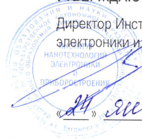
График ликвидации академической задолженности, добора баллов и консультаций ППС ИНЭП в весеннем семестре 2024/2025уч.г.