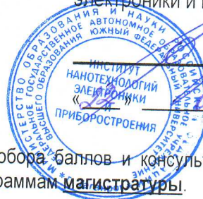
График ликвидации академической задолженности, добора баллов и консультаций ППС ИНЭП в весеннем семестре 2018/2019 уч.г. для студентов, обучающихся по программам магистратуры .