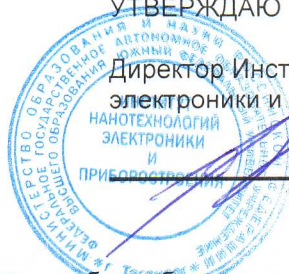
График ликвидации академической задолженности, добора баллов и консультаций ППС ИНЭП в весеннем семестре 2017-2018 уч.г. для студентов, обучающихся по программам магистратуры .